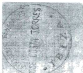
50 i 51