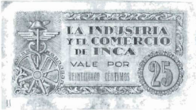
16 al 18